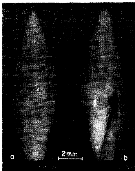
Figura 1 — Mitra (Cancilla) saldanha sp. nov. — a) vista dorsal; b) vista ventral.