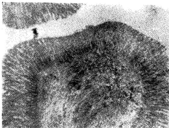
Figura 1 — Mucosa do esôfago do pargo, Lutjanus purpureus Poey. (Oc. K 6,3 : 1. obj. 20/0,40).

proximidades do estômago, sendo substituídas por células cilíndricas de núcleo basal e oval, sendo que aí representam a quase totalidade das células do epitélio.