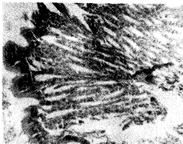
Figura 2 — Fossetas gástricas do estômago do pargo, Lutjanus purpureus Poey. (Oc. K 6,3 : 1, obj. 20/0,40).

Pode-se distinguir três tipos celulares diferentes nas glândulas gástricas: células mucosas, parietais e mucosas do colo. Não foram estudadas as células zimogênicas e argenta-