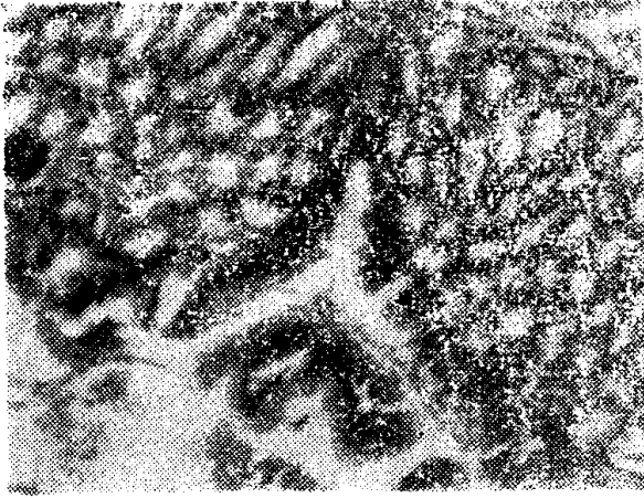
Figura 3 — Glândulas gástricas do estômago do pargo, Lutjanus purpureus Poey. (Oc. K 6,3 : 1, obj. 20/0,40) .

fins, uma vez que as colorações utilizadas não evidenciam tais células. Entretanto, estas são referidas, por muitos autores, como componentes das glândulas gástricas do estômago de peixes.